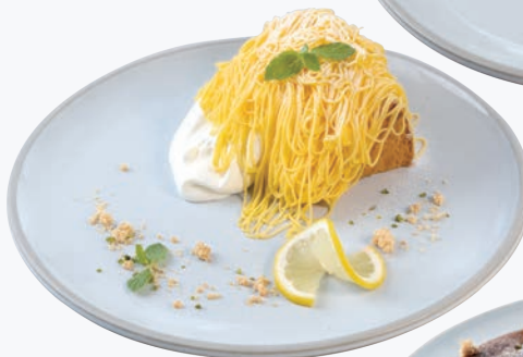
レモンクリーム 864円(税込950円)