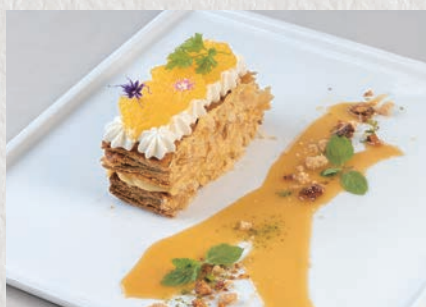
キャラメルオレンジのパイミルフィーユ 864円(税込950円)