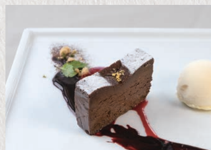
濃厚チョコレートテリーヌ 773円(税込850円)