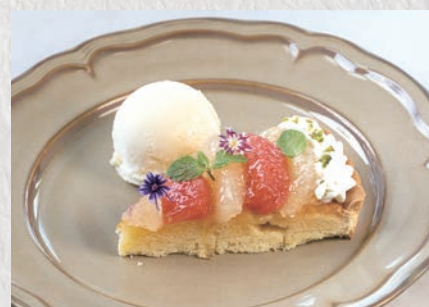
グレープフルーツと紅茶のタルト 773円(税込850円)