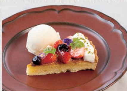
イチゴのフルーツタルト 773円(税込850円)