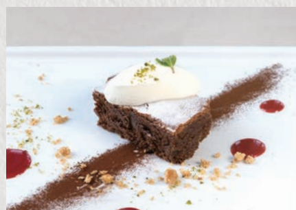
シェフ特製ガトーショコラ 773円(税込850円)