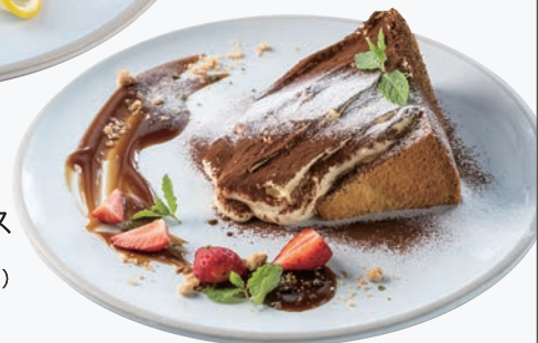
ティラミス 1,000円(税込1,100円)