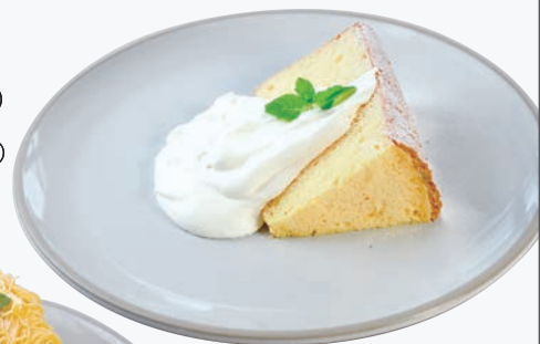
プレーン(メープル付) 773円(税込850円)