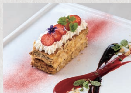
イチゴのパイミルフィーユ 864円(税込950円)