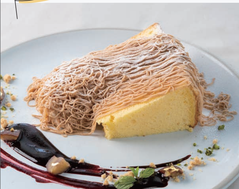
モンブラン 1,000円(税込1,100円)